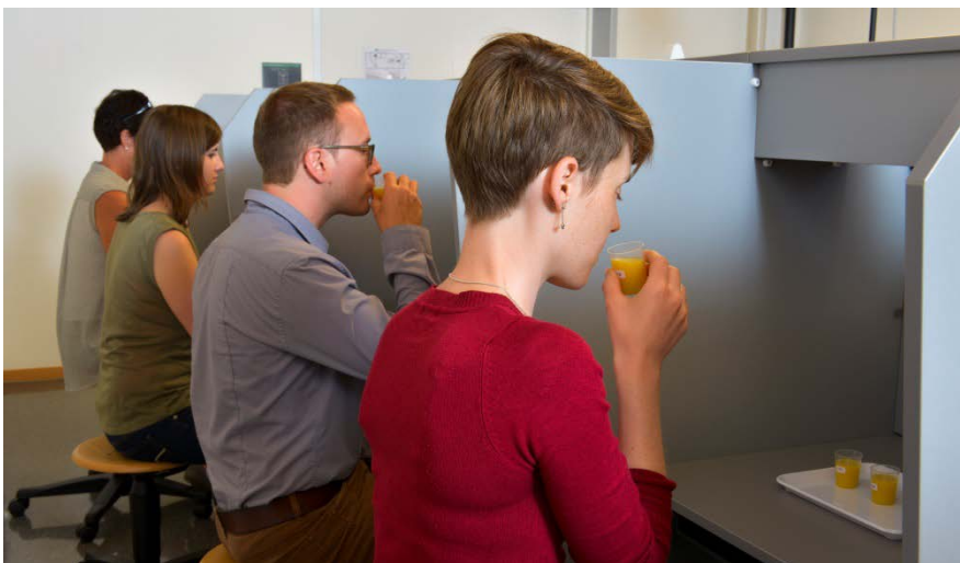
Testpersonen degustieren Orangensaft in Prüfkabinen.

Natürlich werden Ihre Angaben immer anonym behandelt und es werden keine Rückschlüsse auf einzelne Daten gezogen. Durch Ihre Anmeldung im Konsumentenpanel erklären Sie sich einverstanden, dass wir Sie über künftig stattfindende Konsumententests respektive Online-Umfragen informieren.