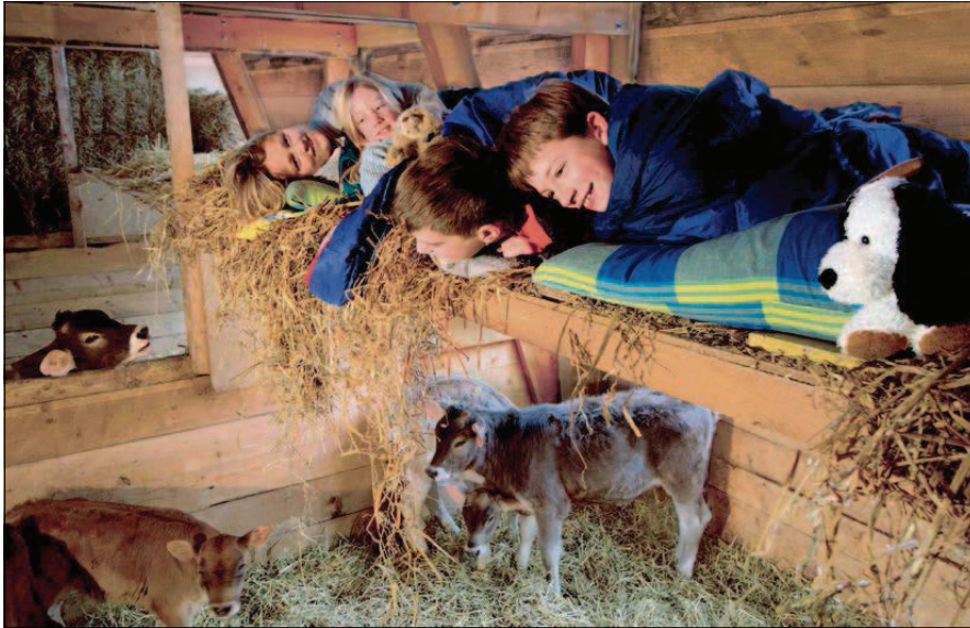
Familien sind nach wie vor die Hauptzielgruppe des Agrotourismus, etwa mit dem Angebot «Schlafen im Strohhalm».

Agrotourismus eignet sich nicht nur für Familien mit kleinen Kindern. Gefragt sind zunehmend Angebote für Geniesser mit höheren Komfortansprüchen und für MICE-Gäste.