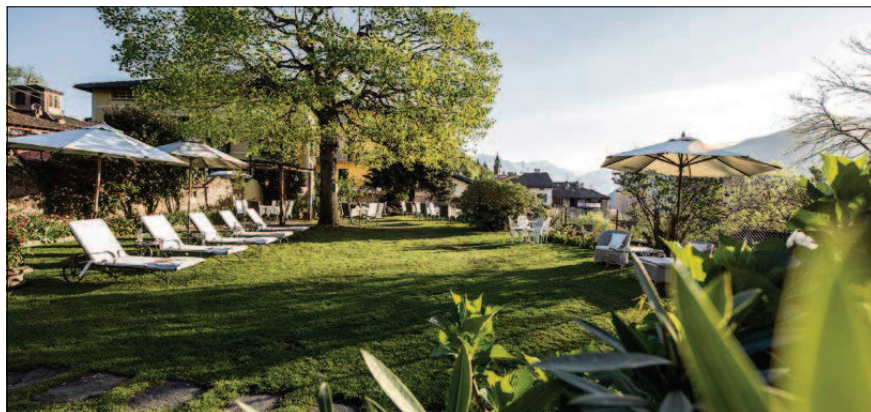
Das Hotel Villa Carona in Carona (TI) und sein Garten sind Teil der neuen Kooperation «Garten Hotels Schweiz». Seite 13. Andrea Badrutt